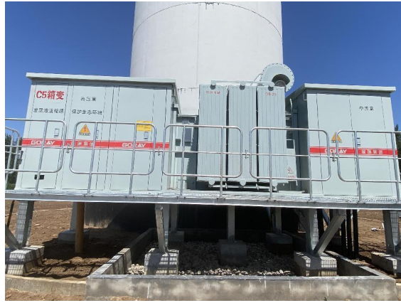
图 4-3 风电机组