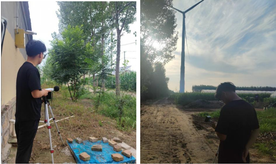
图 4-4 现场监测照片