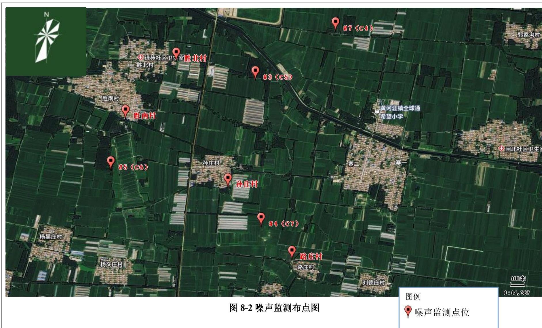
图 8-2 噪声监测布点图