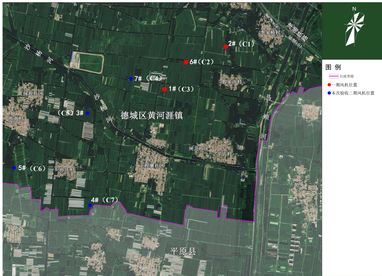
图 4-2 本项目风电机组平面布置图