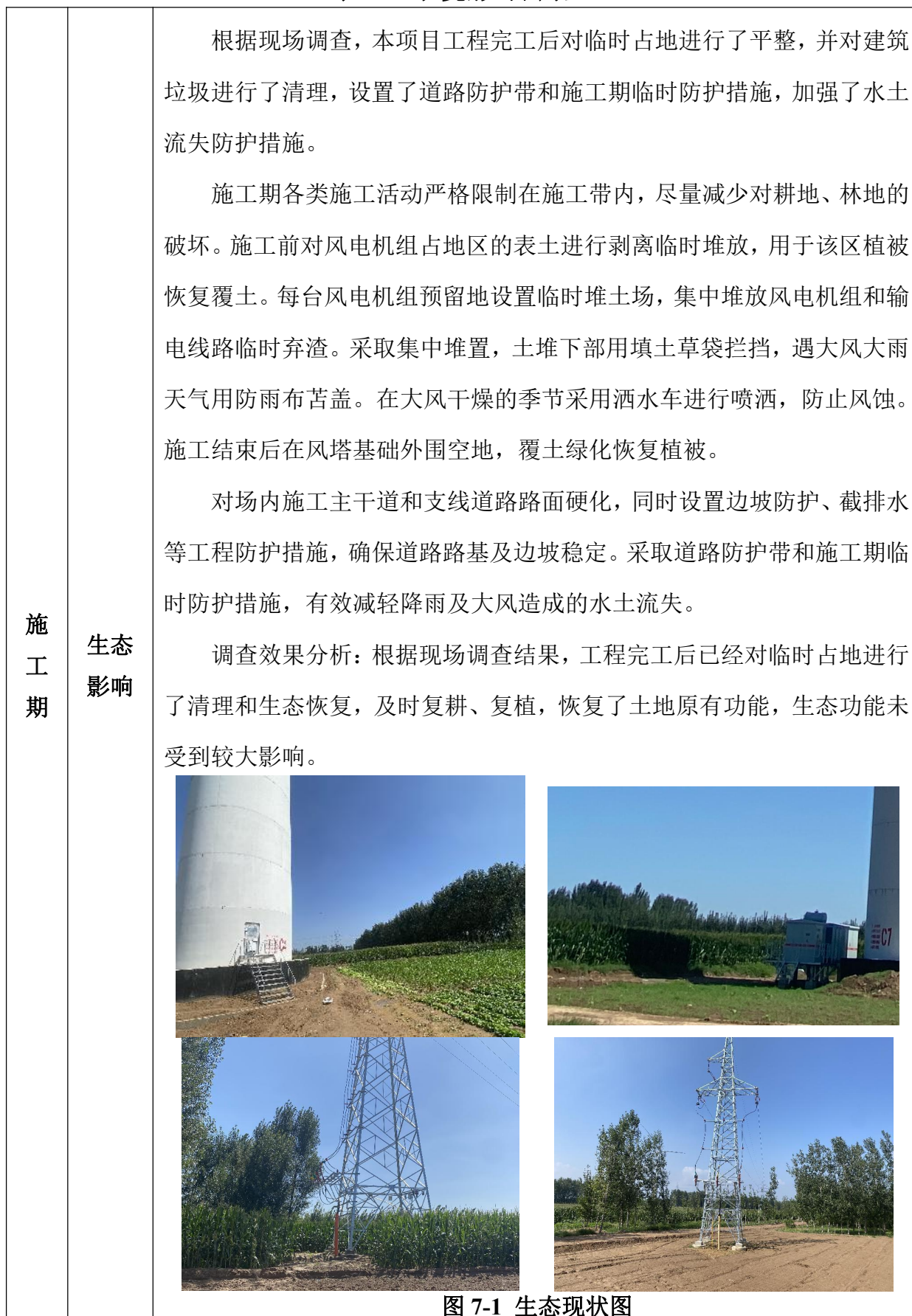
表 7 环境影响调查